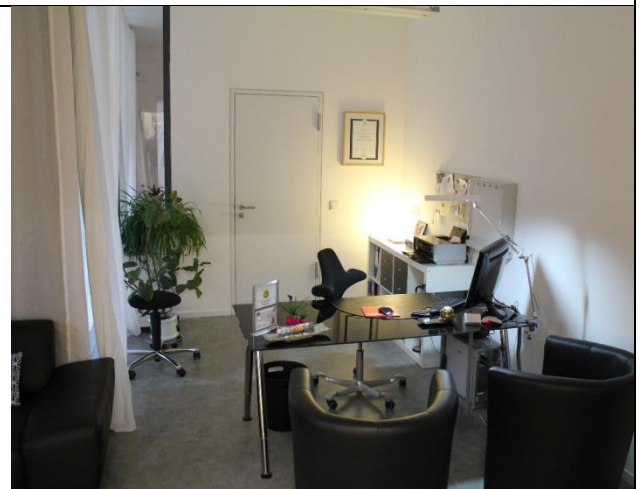
...das Sprechzimmer 2...