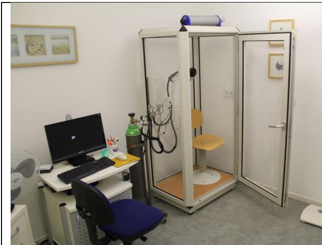
...die Lungenfunktion, Herzstück der Praxis...