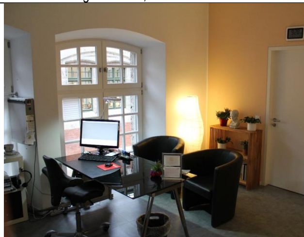
...das Sprechzimmer 1...