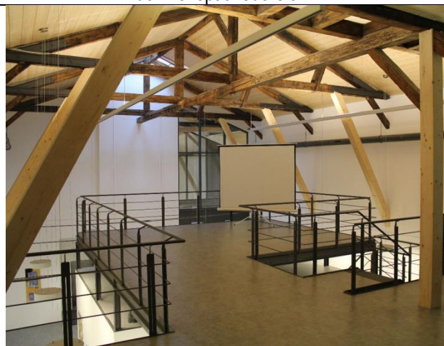
...die „Empore“ für Vorträge etc...