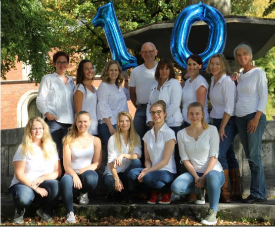
...das Team 1998 (10-Jähriges)...