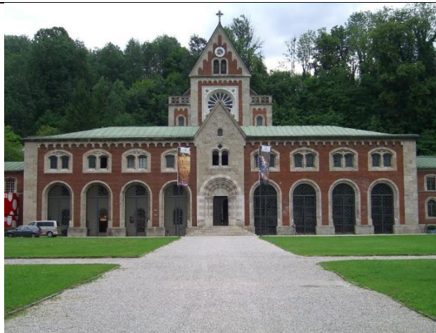
Das Haupt-Brunnhaus der Alten Saline...