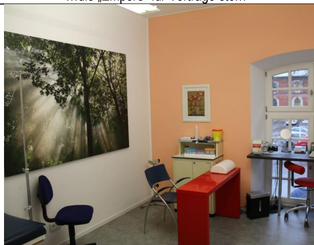
...das Labor mit Allergologie...